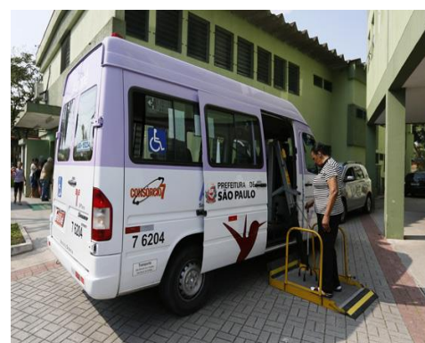
São Paulo Mais Inclusiva – Serviço Atende